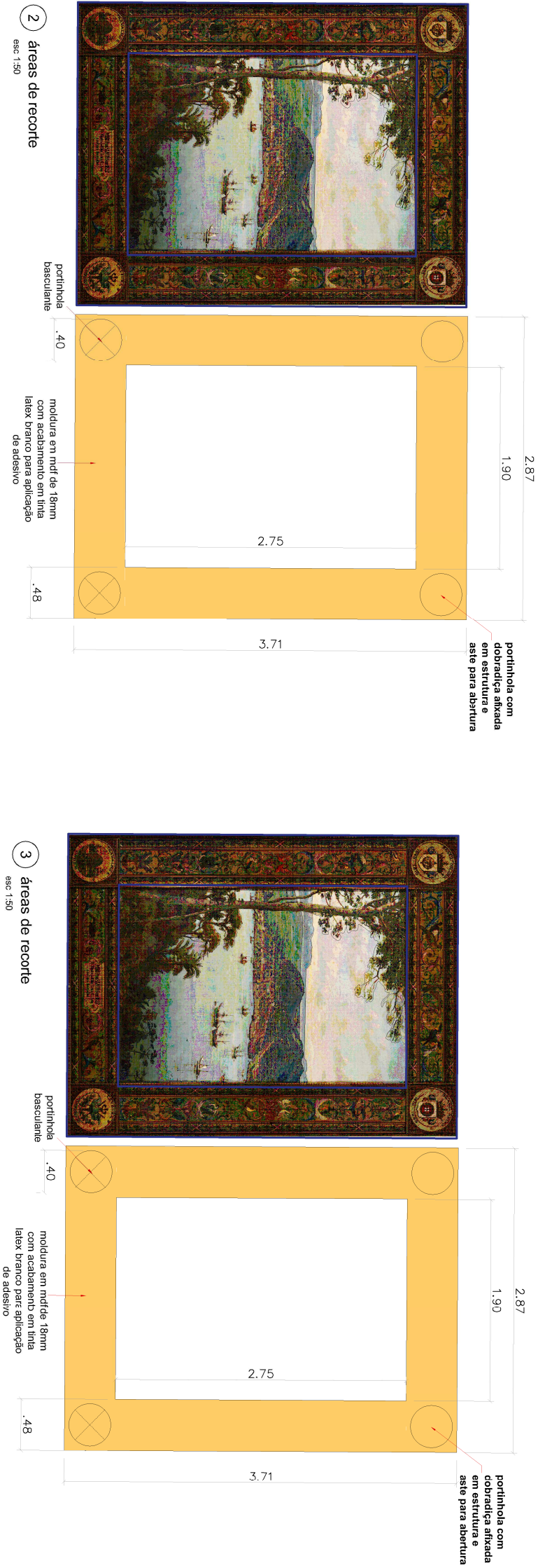
2 áreas de recorte esc. 1:50